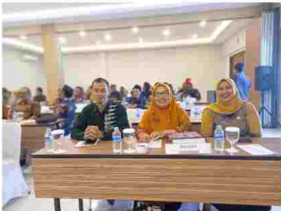
(Mendengarkan Materi yang diberikan oleh Narasumber)