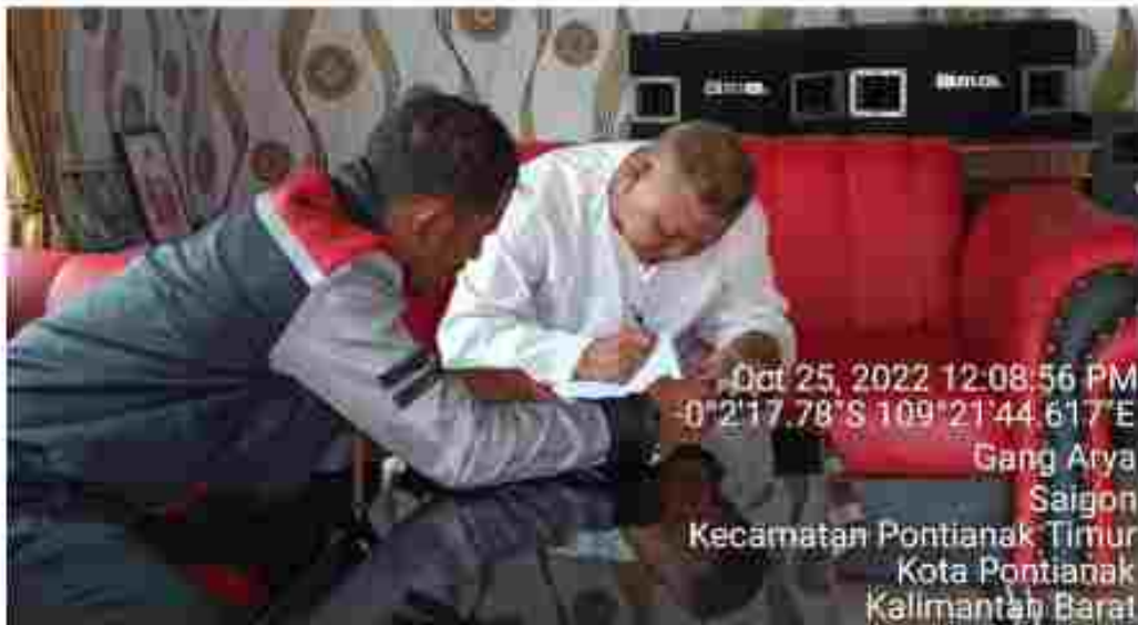
(Tim Verifikator melakukan Verifikasi Faktual Calon Keanggotaan Partai Politik Peserta Pemilu 2024)