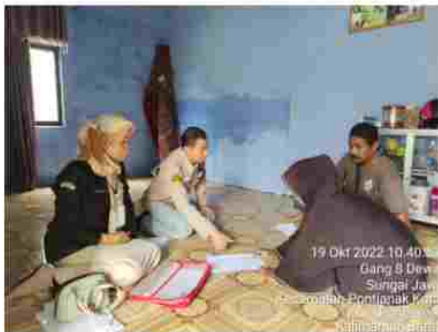
(Tim Verifikator melakukan Verifikasi Faktual Calon Keanggotaan Partai Politik Peserta Pemilu 2024)