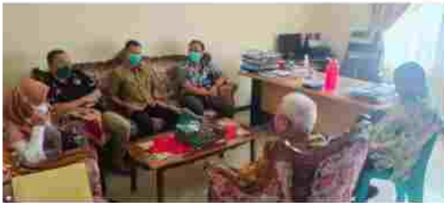
(Koordinasi di Kelurahan Banjar Serasan )