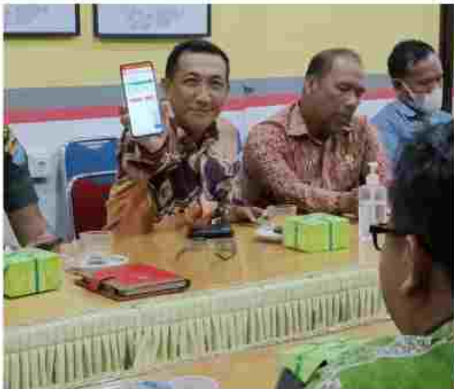
(Mensosialisasikan Lindungi Hakmu Mobile)