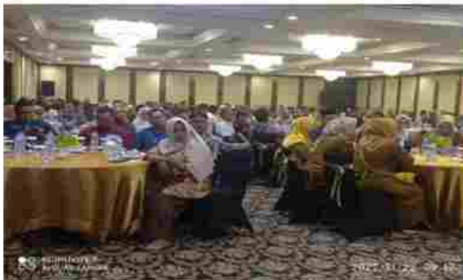
(Para peserta Sosialisasi Tata Muka bersama RT/RW)