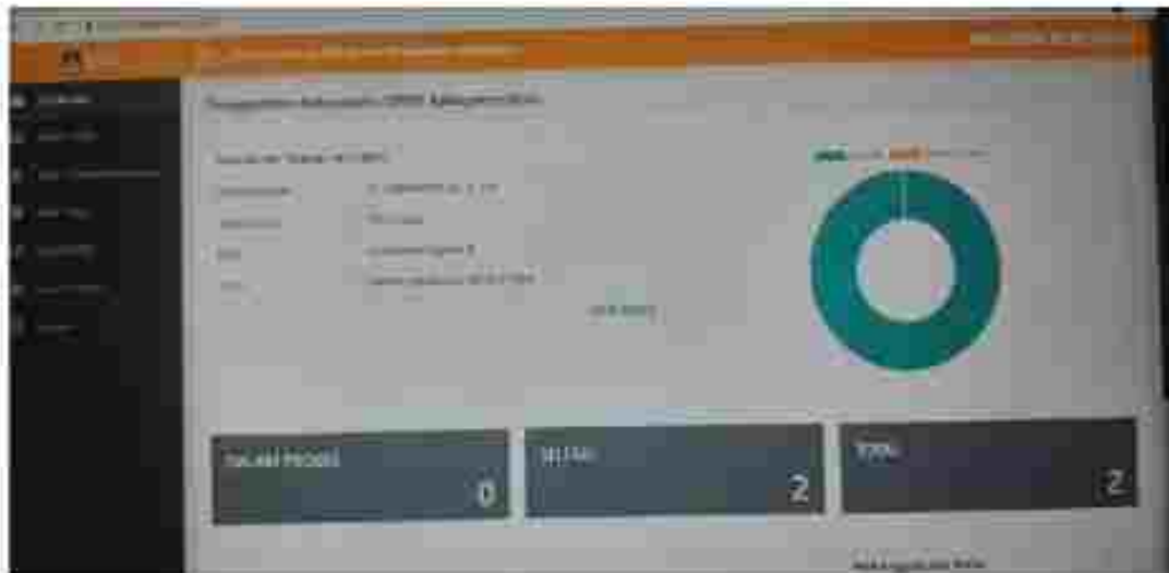
(Dokumentasi Tampilan layar portal Sistem Informasi Penggantian Antarwaktu)