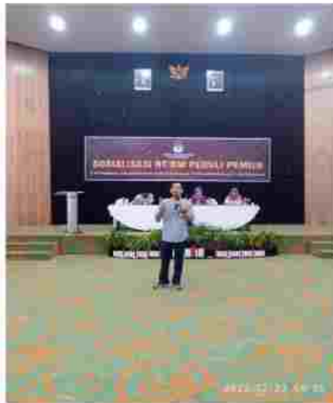
(Ketua KPU Kota Pontianak memberikan materi Sosialisasi RT/RW Peduli Pemilu)