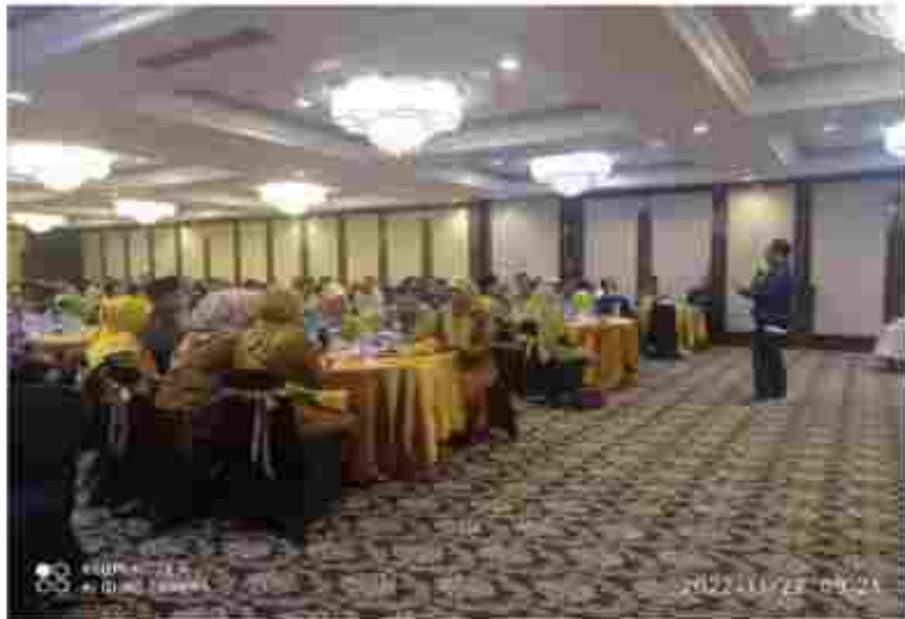
(Para peserta Sosialisasi Tata Muka bersama RT/RW)