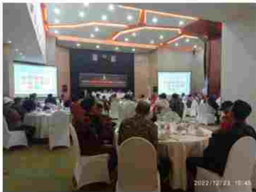
(Para peserta Sosialisasi Tata Muka bersama RT/RW)