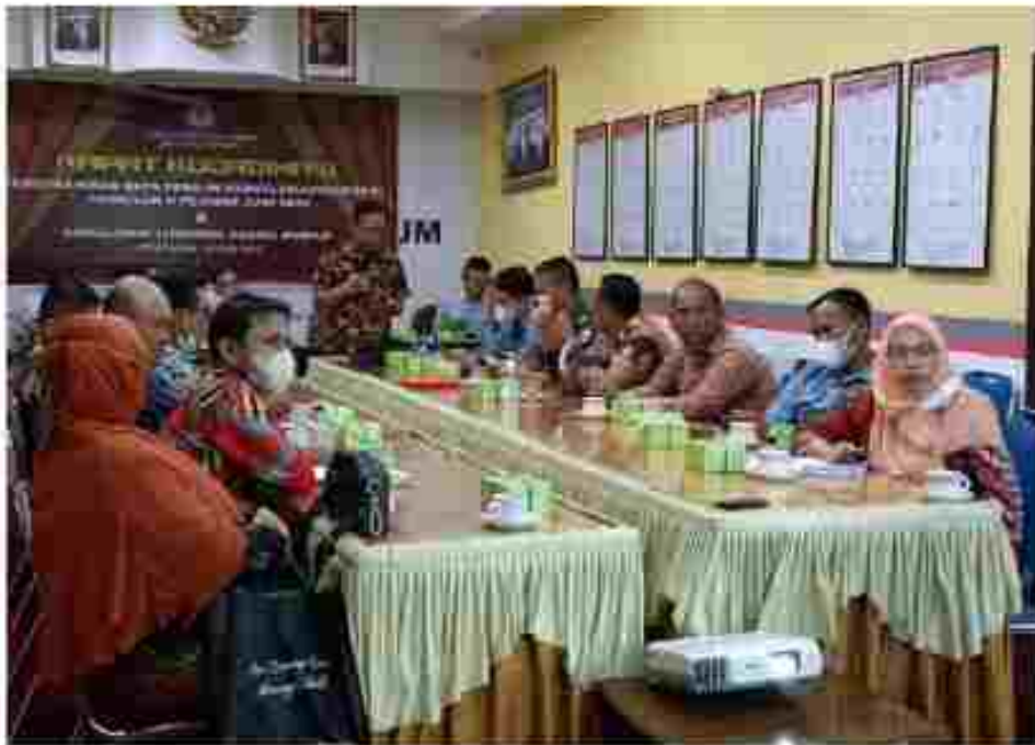
(Rapat Koordinasi PDPB bersama Camat Se-Kota Pontianak dan Instansi terkait)