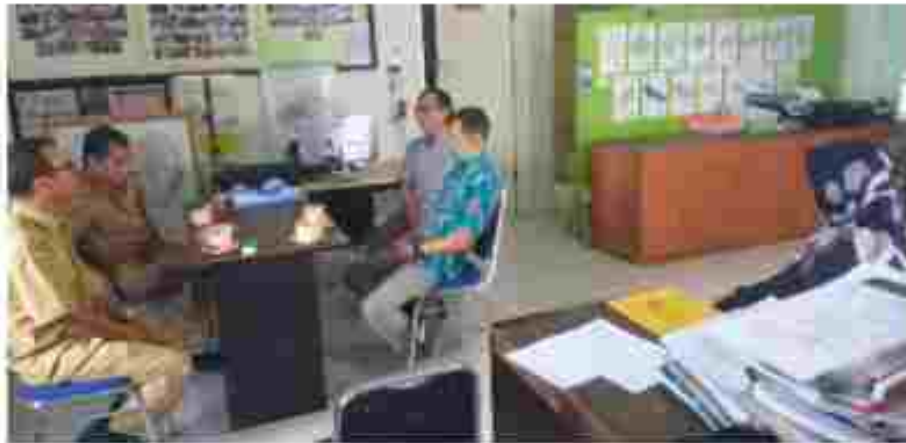
(Koordinasi di Kelurahan Alcaya)