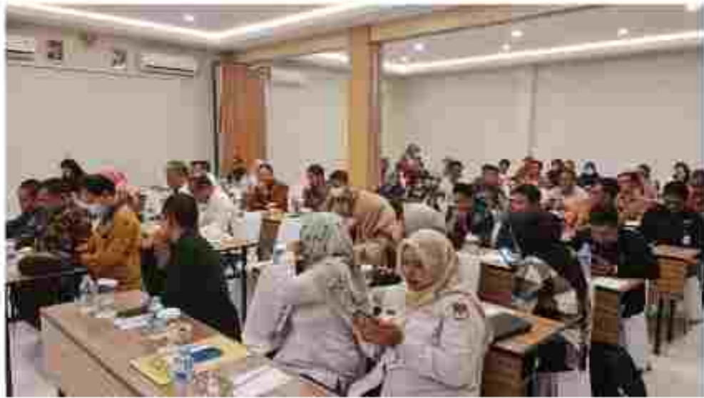
(Mendengarkan Materi yang dibenkan oleh Narasumber)