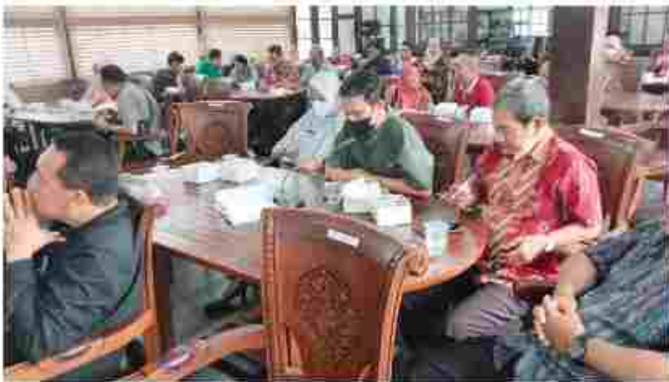
(Peserta kegiatan mendengarkan materi)