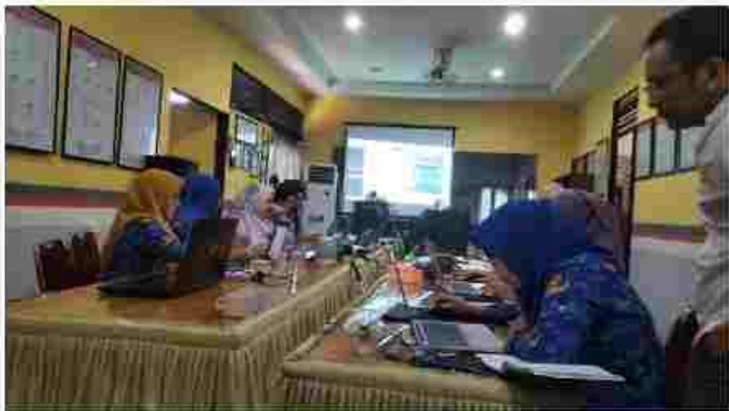
(Tim Verifikator melakukan Verifikasi Administrasi Calon Keanggotaan Partai Politik Peserta Pemilu 2024 pada Aplikasi SIPOL)