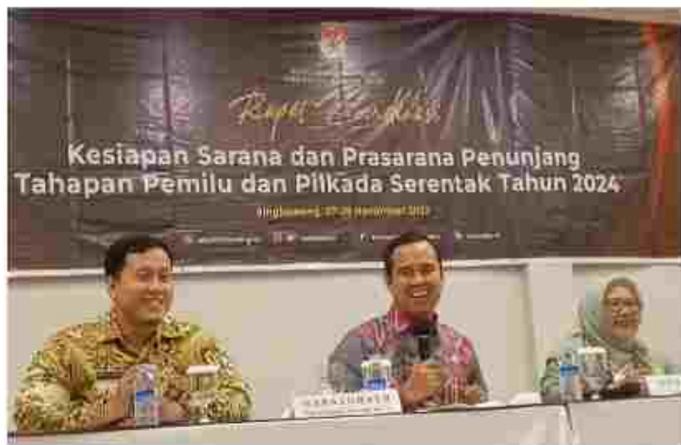
(Narasumber sedang memberikan Materi)

Logistik adalah Jantungnya Pemilu maka Prinsip Dasar Pemilu harus Tepat Jumlah, Tepat Jenis, Tepat Sasaran, Tepat Waktu dan Tepat Kualitas. Perencanaan Kebutuhan Logistik dimulai dengan kegiatan pengumpulan data yang dilakukan secara berjenjang pada 2 tahun sebelum tahun penyelenggaraan pemilu/pilkada. Persoalan yang dihadapi sekarang dalam pengelolaan logistik pada Pemilu 2024 adalah sedikitnya waktu berkisar 80 hari dari proses pengadaan hingga distribusi.