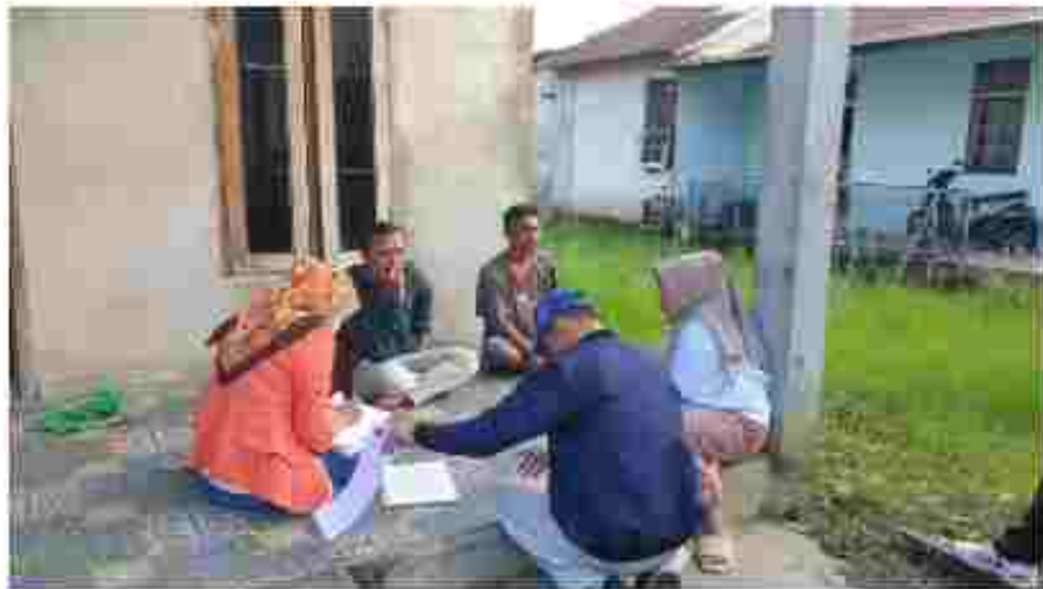
(Tim Verifikator melakukan Verifikasi Faktual Calon Keanggotaan Partai Politik Peserta Pemilu 2024)