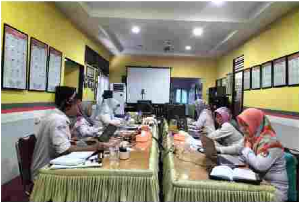
(Tim Verifikator melakukan Verifikasi Administrasi Calon Keanggotaan Partai Politik Peserta Pemilu 2024 pada Aplikasi SIFOL)