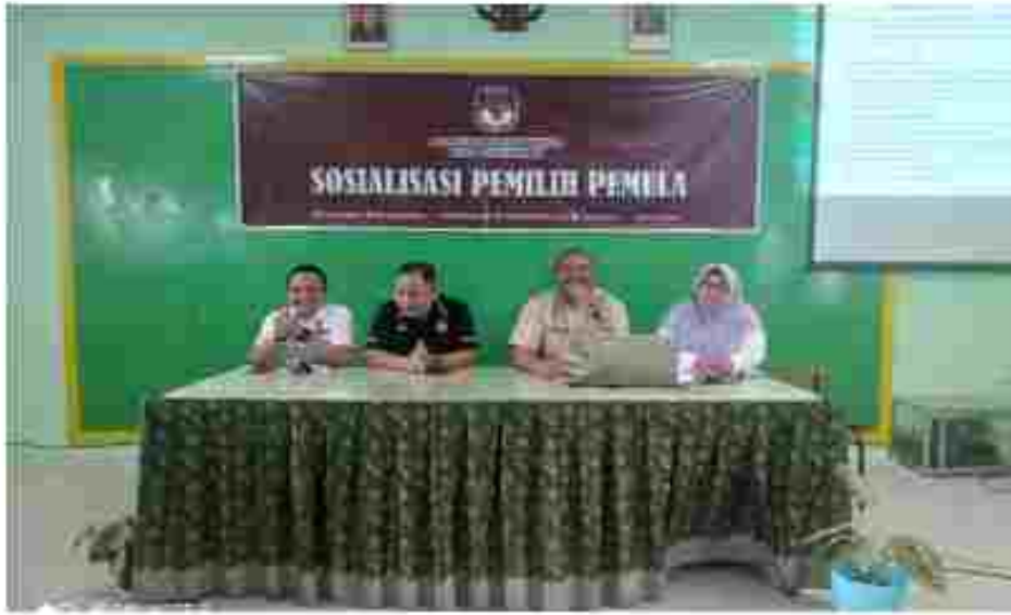
(Anggota KPU Kota Pontianak memberikan Materi Sosialisasi Pemilih Pemula)