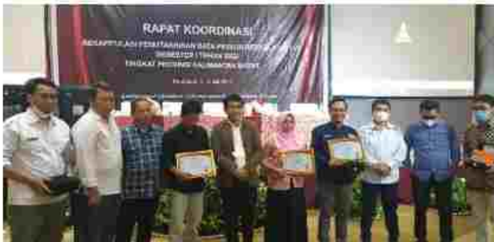
(Pemberian Penghargaan oleh KPU Provinsi Kalimantan Barat kepada KPU Kota Pontianak terbaik ke-3 atas Prestasi Akuntabilitas Kinerja Tahun 2021)