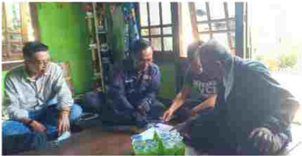
(Tim Verifikator melakukan Verifikasi Faktual Calon Keanggotaan Partai Politik Peserta Pemilu 2024)