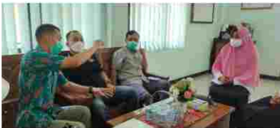
(Koordinasi di Kelurahan Parit Mayor)