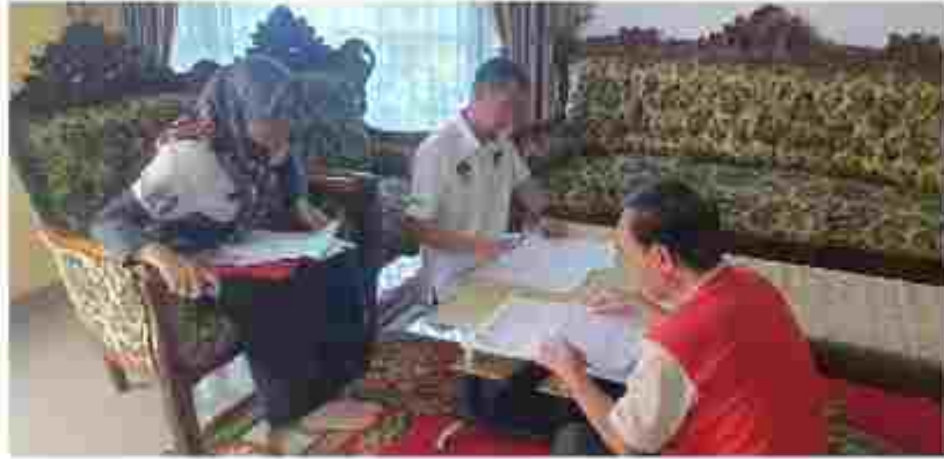
(Tim Verifikator melakukan Verifikasi Faktual Calon Keanggotaan Partai Politik Peserta Pemilu 2024)