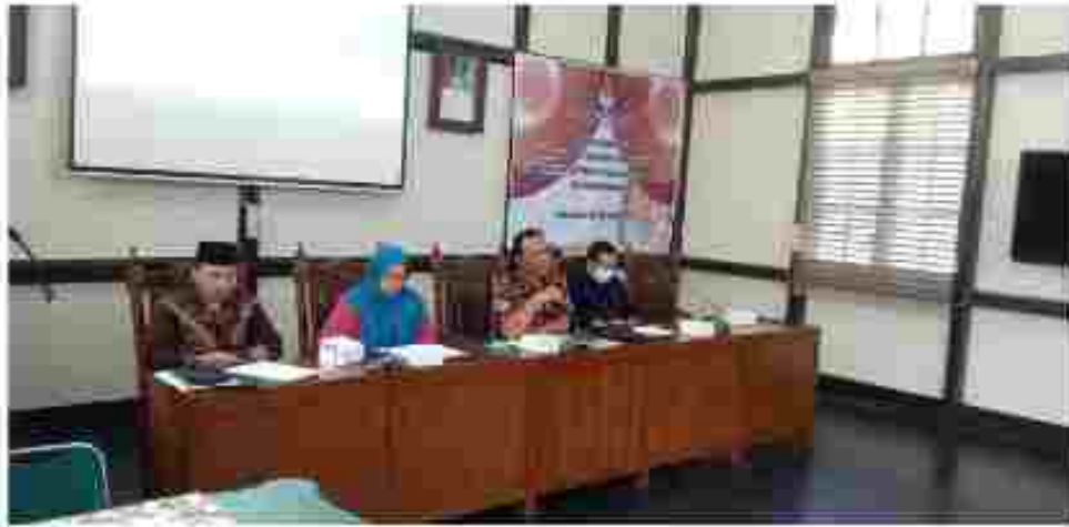
(Komisioner KPU Kota Pontianak memberikan materi tentang PDPB)